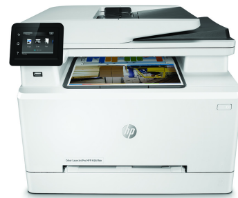
Impresoras multifunción HP LaserJet Pro M281fdn/M281fdw a color

Impresora con seguridad dinámica habilitada. Para ser exclusivamente utilizada con cartuchos que utilicen un chip original de HP. Es posible que no funcionen los cartuchos que no utilicen un chip de HP, y que los que funcionan hoy no funcionen en el futuro. Obtenga más información en: http://www.hp.com/go/learnaboutsupplies