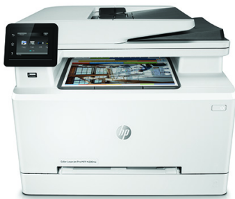
Impresora multifunción HP LaserJet Pro M280nw a color

Cree un impacto gracias a la gran calidad del color y a una productividad incrementada. Obtenga la velocidad de impresión a doble cara y el tiempo de salida de la primera página (FPOT) más rápidos de su categoría. 1,2 Escanee, copie y envíe faxes. Cuento con soluciones de seguridad sencillas y obtenga una sencilla impresión móvil. 3