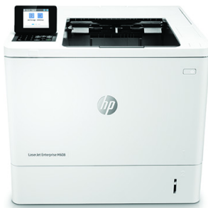
HP LaserJet Enterprise M608n

Esta impresora HP LaserJet con JetIntelligence combina un rendimiento excepcional y la eficiencia energética con documentos de calidad profesional justo en el momento en que los necesita, protegiendo la red con la mayor seguridad del sector. 1