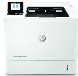
HP LaserJet Enterprise M608dn