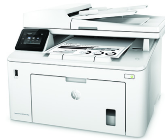
Impresora multifunción HP LaserJet Pro M227fdw