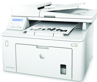
Impresora multifunción HP LaserJet Pro M227sdn

Obtenga más páginas, rendimiento y protección 1 de una impresora multifunción HP LaserJet Pro alimentada por cartuchos de tóner JetIntelligence. Establezca un ritmo más rápido para su empresa: imprima y gestione documentos a doble cara, además de escanear, copiar y enviar faxes, para maximizar la eficiencia.